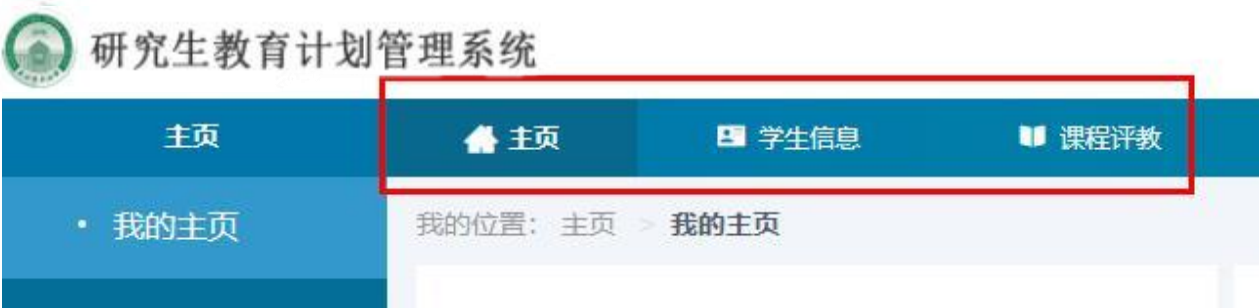
图 2-1 学生端导航栏

登录后，系统系统的顶部导航栏有 3 个模块，如图 1-2 所示，分别是主页、学生信息、课程评教。点击【课程评教】模块，进入课程评教页面。