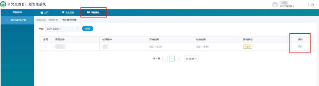
图 3-1 教学课程评教

如图 3-1 中所示，课程评教页显示需要学生参与评教的课程信息，学生可对“评教中”的课程进行评教。单击【评价】按钮（左侧红色框位置），进入课程评价页进行打分和评价操作。